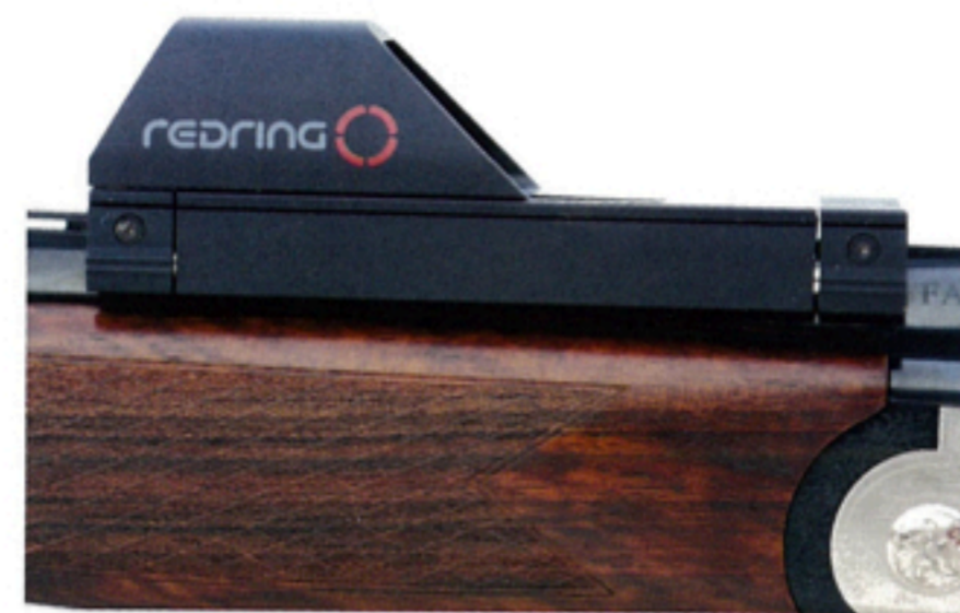
Redring er ikkje spesielt stor eller tung, men likevel eit framdelement på smekker hagle.

Det er enkelt å sjå kvar ring og mål er når skotet går. Og for jegerprøveinstruktørar og andre